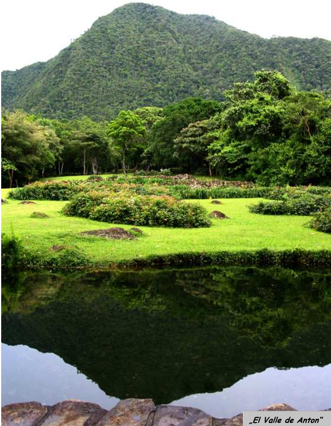
„El Valle de Anton“