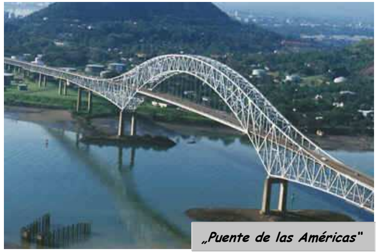
„Puente de las Américas“

nejvýznamnější most přes Panamský průplav, vystavěn v roce 2004, který spojuje kontinent Severní a Jižní Ameriky. Na palubě výletní lodi se nám naskytne úžasný pohled... plavidlo proplovající plavební