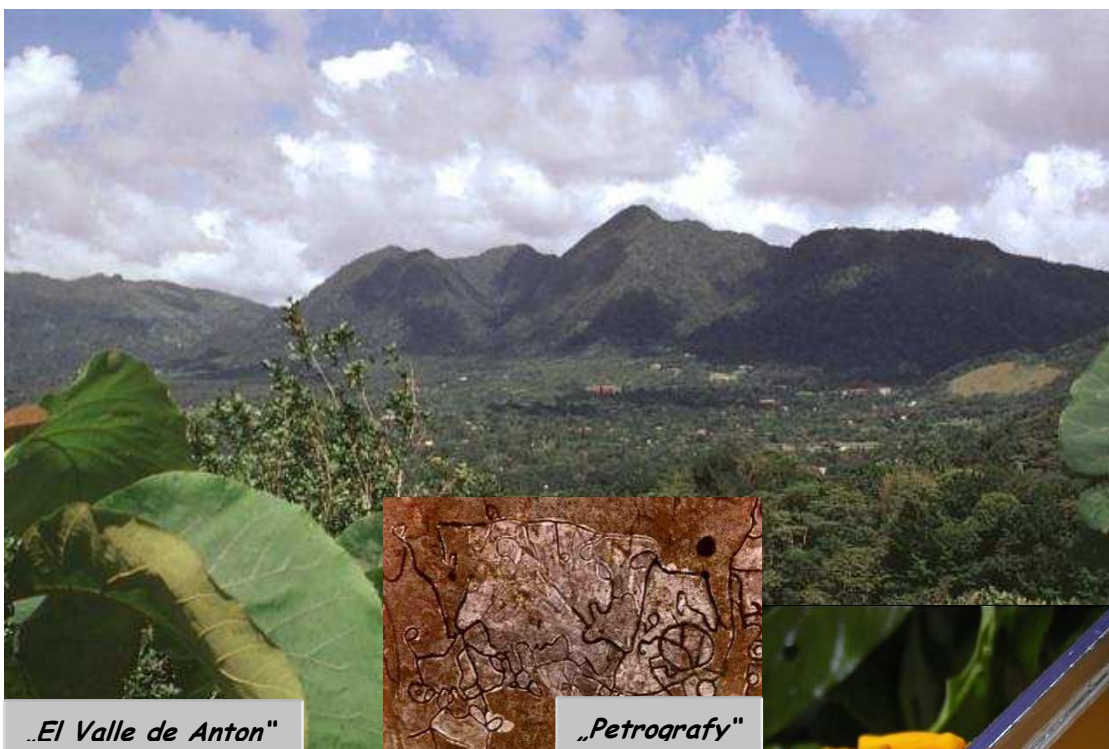
„El Valle de Anton“

Po příjezdu do údolí navštívíme barvitý trh uměleckých řemesel s bohatou nabídkou produktů rukodělné výroby. Po zakoupení suvenýrů, které nám navždy budou připomínat půvab středoamerické země, vystoupáme pěšky na kolem ležící svahy, odkud se nám naskytnou skvostné pohledy na přírodní krásy údolí.